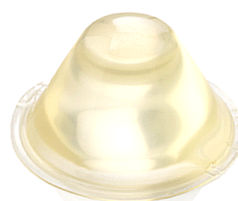
Stand-off II (Long)