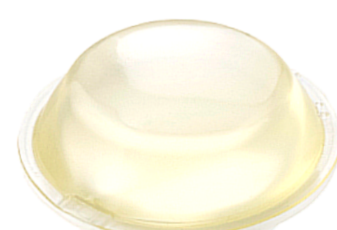
Stand-off I (Short)